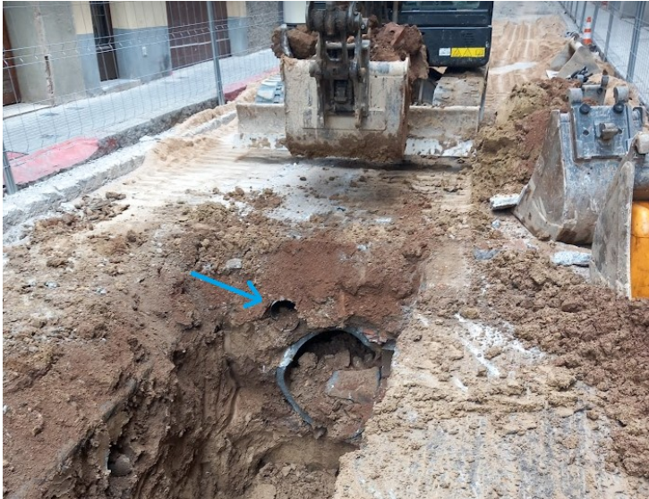
Imatge on s'indica la canalització de fibrociment a retirar.

El total de les feines que s'han de realitzar són totes fora de pressupost, són partides noves no incloses en el projecte aprovat