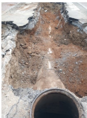
Imatge de la traça de la connexió de l'ovoide a la ctra. de Roda.

Per poder encabir els dos tubs de clavegueram de 1200 es va enderrocar el pou de connexió i executar una cambra per tal que els dos tubs puguin connectar-se a la ctra. de Roda. En tel procés d'excavació va aparèixer un estrat de roca que es va haver de picar per tal de poder seguir la cota de desguàs dels nous tubs de clavegueram.