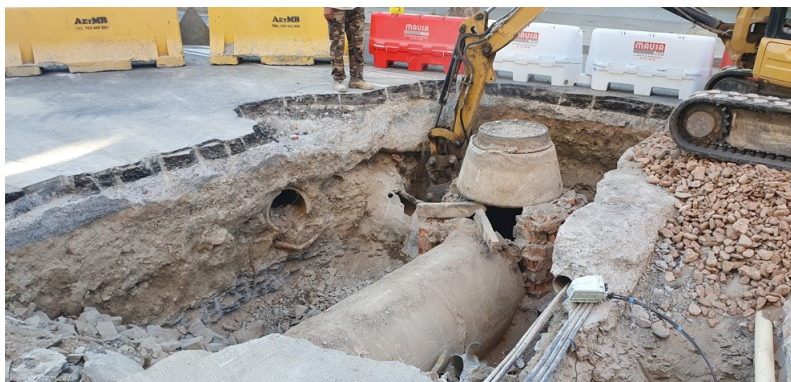
Imatge de la connexió del clavegueram del carrer Nou a la carretera de Roda on es pot observar que només hi ha una sola claveguera i que la roca es troba a uns 70 cm de profunditat.