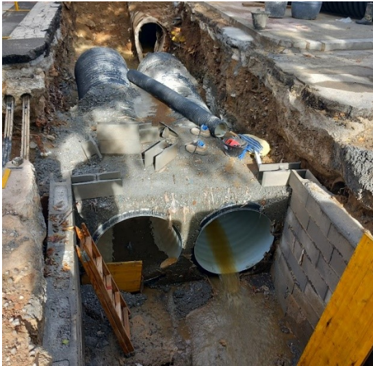
Imatge de la substitució del tub ovoide, de la prolongació del tub de clavegueram central i la cambra de connexió.