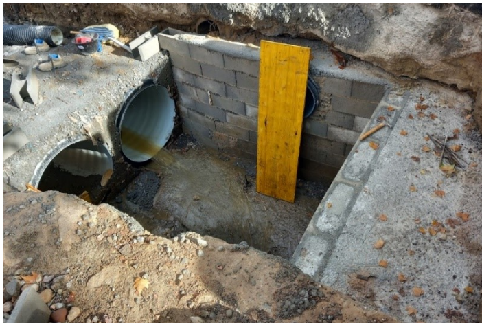
Imatge de la cambra de connexió dels 2 tubs de clavegueram del c/Nou amb el clavegueram de la ctra. de Roda.